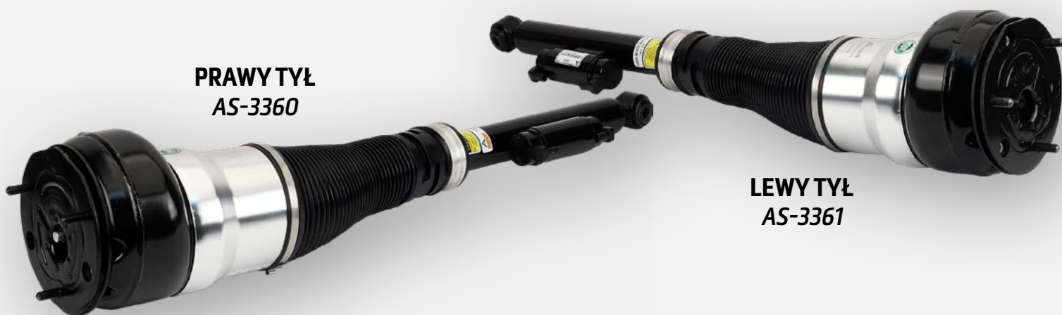
LEWY TYŁ AS-3361